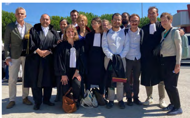
Une partie des observateurs turcs et internationaux lors de l'audience du 7 septembre 2022 (représentant, entre autres: barreau d'Istanbul, barreau de Paris, Syndicat des Avocats Français, Syndicat des Avocats pour la Démocratie, Barreau de Bruxelles, Avocats.be, Défense Sans Frontières, barreau de Liège-Huy, barreau de Bologne).

Nos confrères et consœurs sont poursuivis pour des infractions liées au terrorisme, en raison de leur appartenance alléguée à une organisation qualifiée de terroriste. Dans les faits, c'est le fait qu'ils et elles défendent des personnes qualifiées de terroristes qui leur est reproché.